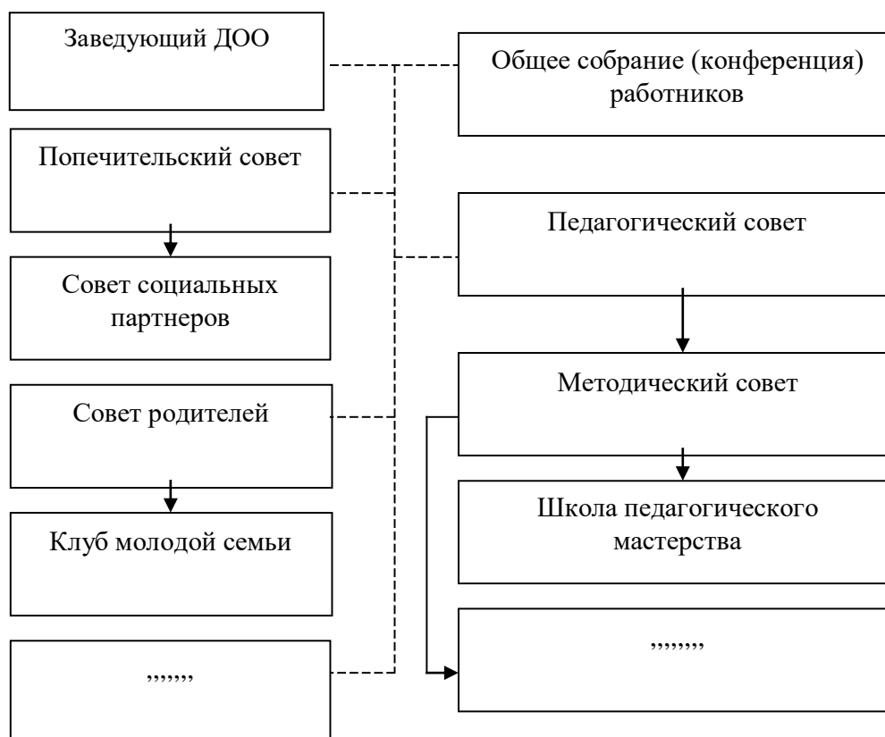
Рис. Модель стратегического развития государственно-общественного управления ДОО